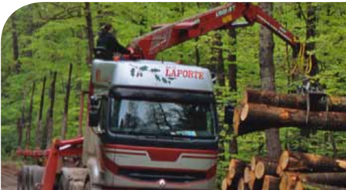
STÄRKUNG DER WETTBEWERBSFÄHIGKEIT DES SEKTORS WALD-FORST-HOLZ

■ Die Bayerische Forstverwaltung hat 14 Arbeitsfelder definiert, in denen die übergeordneten Kernbotschaften konkret in die Praxis umgesetzt werden.